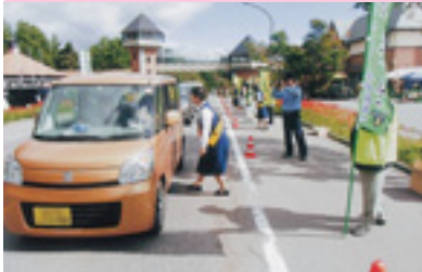
セーフティアドバイス街頭指導