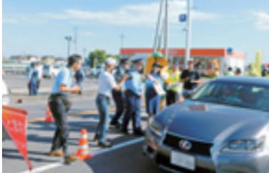
一日警察署長と三交合同街頭指導