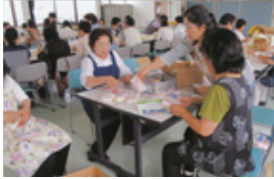
交通安全啓発品の作成