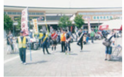
交通安全啓発活動