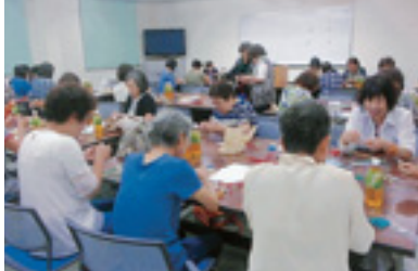
交通安全マスコットの作成