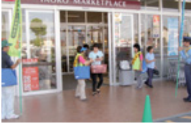
ショッピングママ作戦