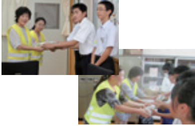
中学生へ反射材の贈呈