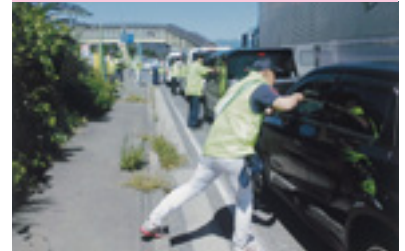
事故現場で交通安全街頭指導

交通安全協会では、皆様の会費によって様々な交通安全活動を行っています。交通安全協会へのご入会をお願いいたします。