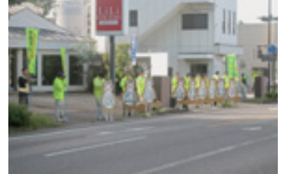
交通安全街頭プラカード作戦