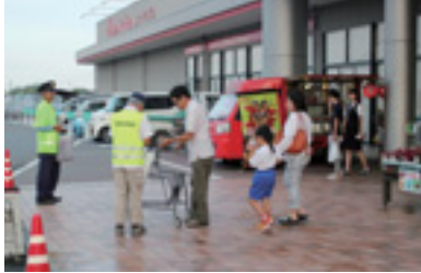
交通安全ショッピング作戦