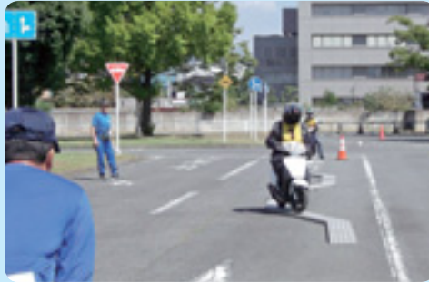
— 実技講習風景 —