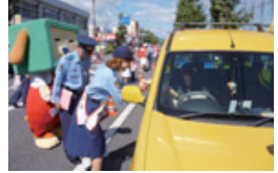
一日警察署長街頭指導