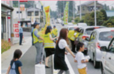
緊急交通対策街頭指導