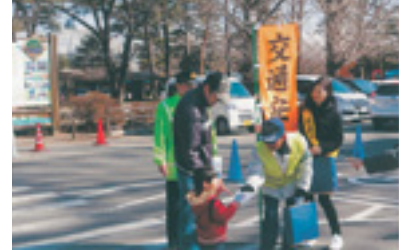
交通安全啓発指導