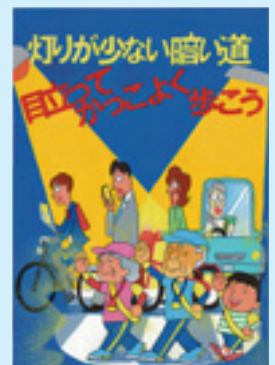
前回の「群馬県知事賞」作品