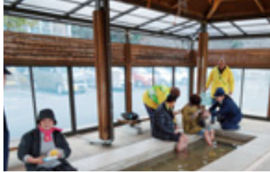
足湯施設で交通安全啓発指導