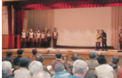
高齢者交通安全教室