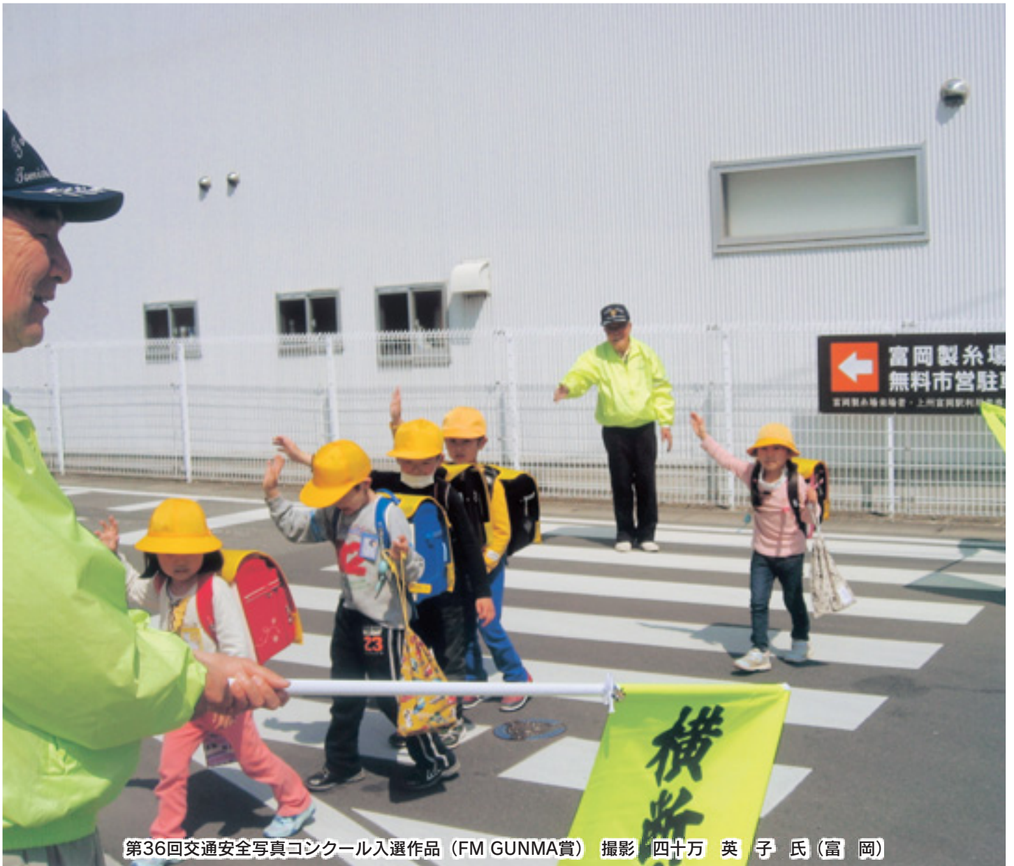
第36回交通安全写真コンクール入選作品 (FM GUNMA賞)