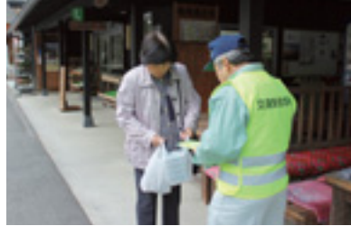
高齢者交通安全指導