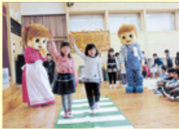
前回の「群馬県知事賞」作品