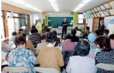
高齢者交通安全教室