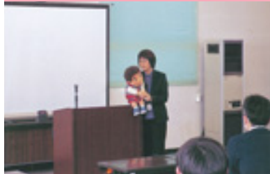
交通安全講話の実施