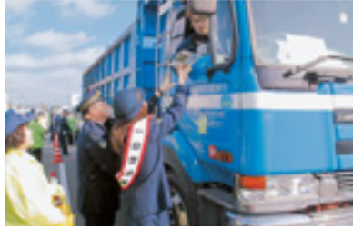
関係団体合同街頭指導