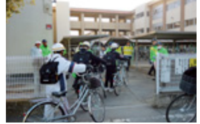
自転車マナーアップ指導