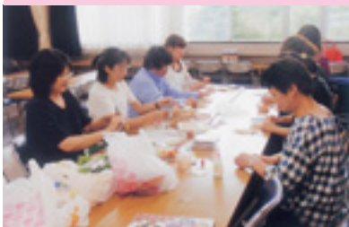
交通安全グッズ作成講習会