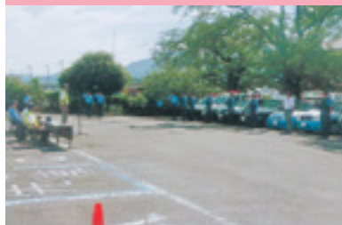
交通安全運動出陣式