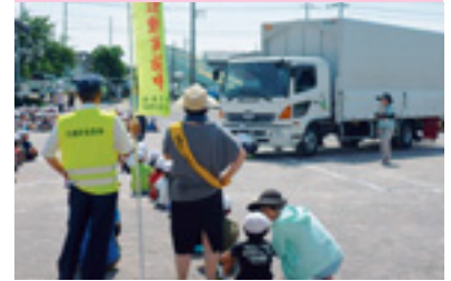
親と子の交通安全教室