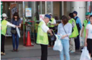
ショッピング作戦