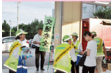
レディース街頭指導