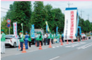
交通関係団体合同街頭指導