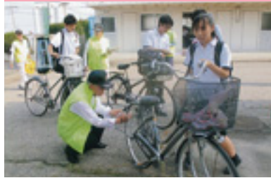
自転車マナーアップ運動