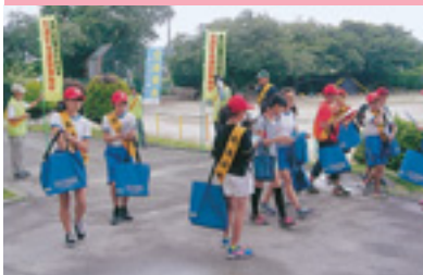
交通少年団街頭指導