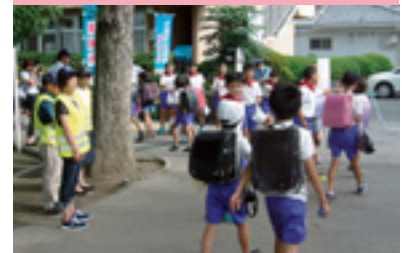
交通少年団街頭指導