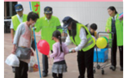
交通安全運動事前啓発活動