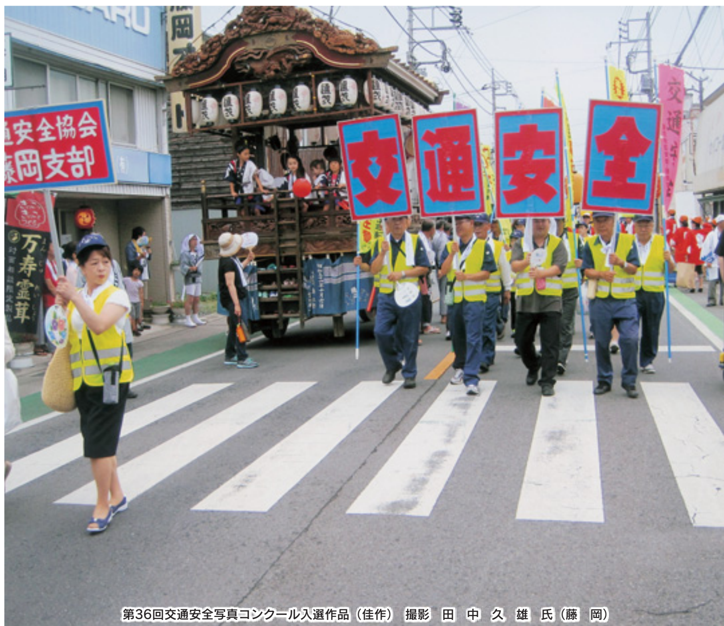
第36回交通安全写真コンクール入選作品(佳作)