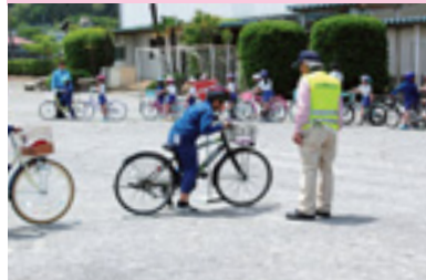
自転車の正しい乗り方教室