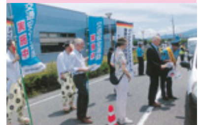
「天狗」等が交通安全街頭指導

交通安全協会では、皆様の会費によって様々な交通安全活動を行っています。交通安全協会へのご入会をお願いいたします。