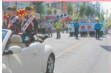
夏祭り交通安全パレード