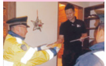
飲酒運転撲滅パトロール

交通安全協会では、皆様の会費によって様々な交通安全活動を行っています。交通安全協会へのご入会をお願いいたします。