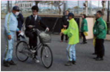
自転車マナーアップ指導