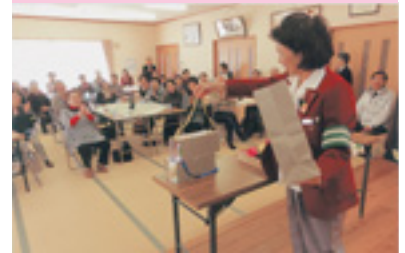
高齢者交通安全教室