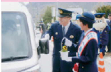
関係団体合同街頭指導