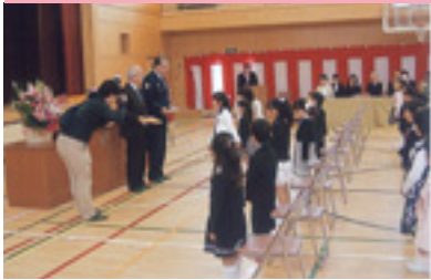
新入学児童に交通安全傘贈呈