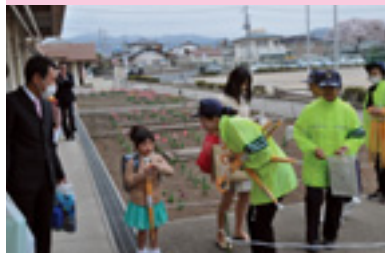
新入学児童に交通安全傘贈呈