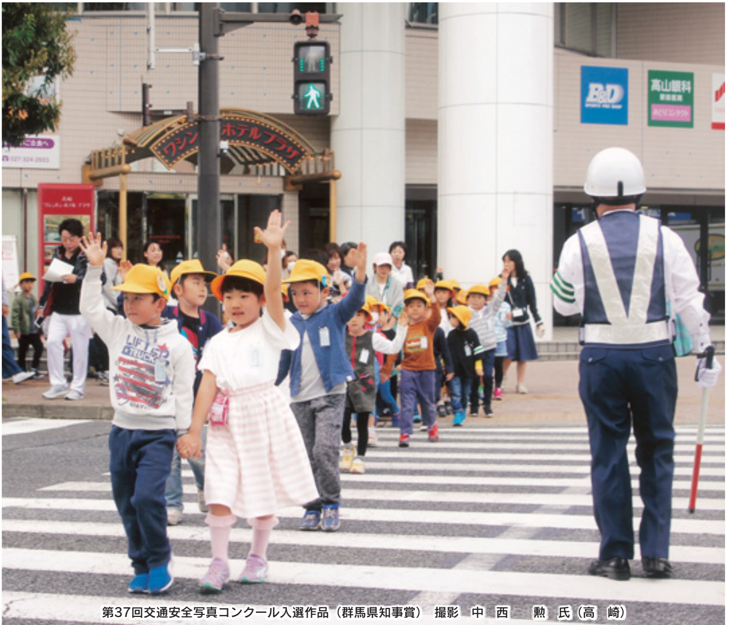
第37回交通安全写真コンクール入選作品（群馬県知事賞）