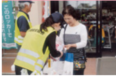
ショッピングママ作戦