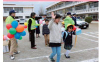
新入学児童交通安全教室