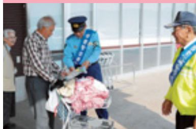
街頭キャンペーン