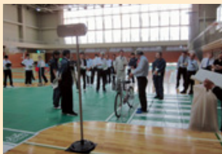
競技指導要領の受講風景

四月二五日(木)、前橋市関根町のALSOKぐんま総合スポーツセンターにおいて、来る六月二日(土)に開催される「第五四回交通安全子供自転車群馬大会」に向け、県内各警察署並びに各地区安協等から指導者(三八名)を一堂に集め、「自転車の正しい乗り方指導者講習会」を開催しました。