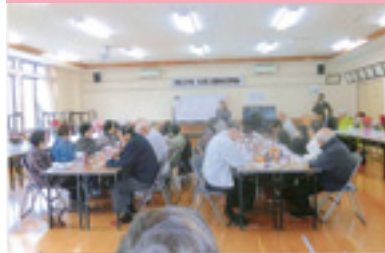
高齢者交通安全教室