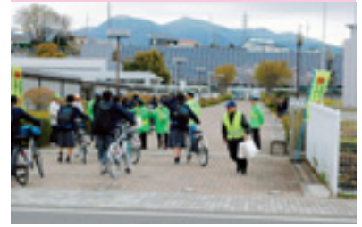
自転車マナーアップ指導