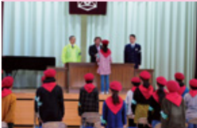
交通少年団委嘱式