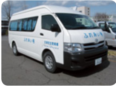
移動式交通安全教育車「ふれあい号」

交通関係機関や団体はもちろん、学校や職場、地域などで幅広くご利用ください。ご利用は無料です。