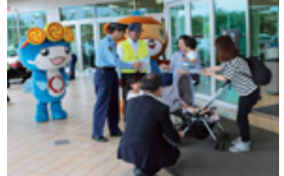
交通関係団体合同街頭啓発