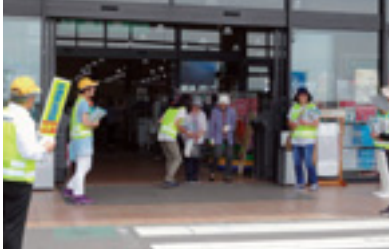
ショッピング作戦