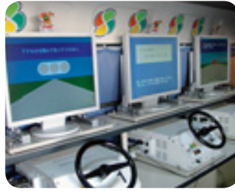
運転適性検査機器の状況