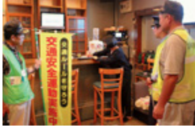
飲酒運転追放パトロール