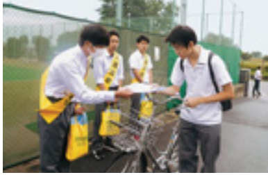
自転車マナーアップ指導