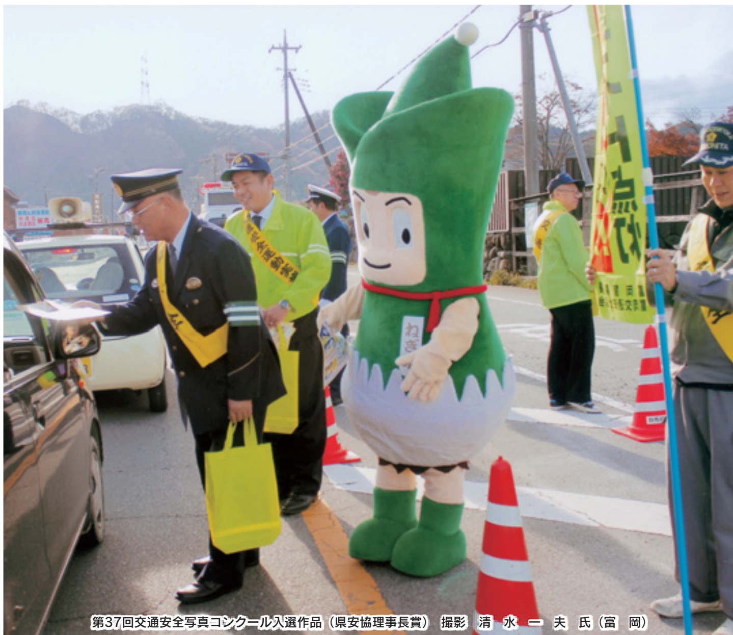
第37回交通安全写真コンクール入選作品 (県安協理事長賞) 撮影 清水一夫氏 (富岡)