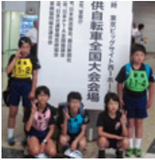
西部小学校チーム