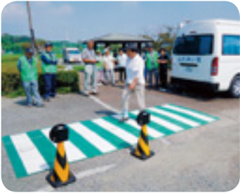
横断歩行トレーナー体験の状況