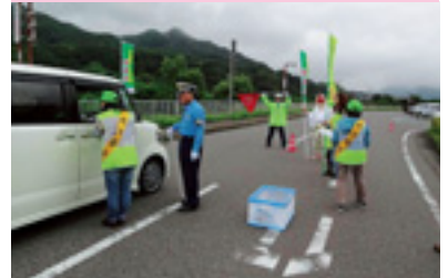
セーフティドライバー作戦

交通安全協会では、皆様の会費によって様々な交通安全活動を行っています。交通安全協会へのご入会をお願いいたします。