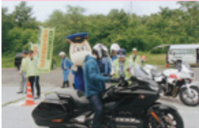
二輪車交通安全街頭指導