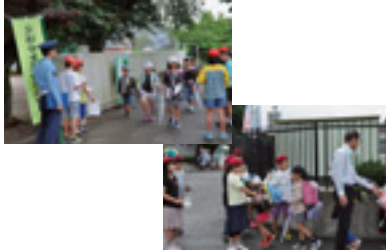
交通少年団交通安全指導