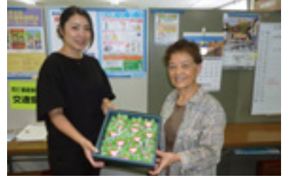
女性部員交通安全啓発品作成