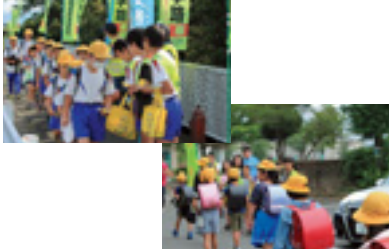
交通少年団交通安全指導