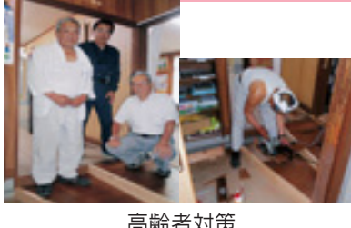
高齢者対策 (安協会員が事務所段差改修)