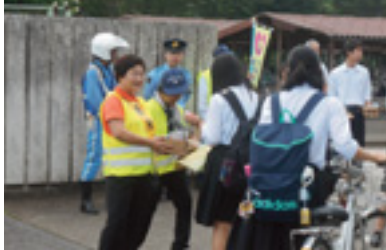
自転車マナーアップ指導