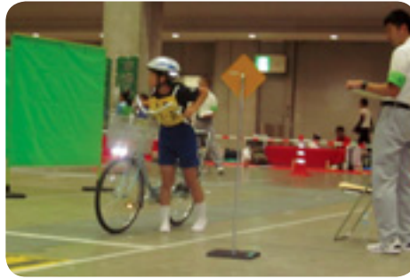
安全走行・技能走行の競技風景