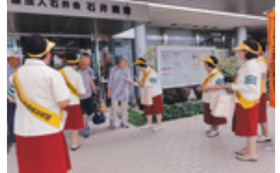
高齢者交通安全啓発活動