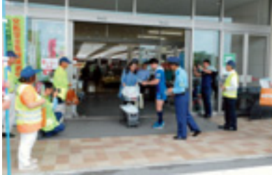
ショッピング作戦