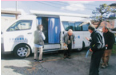
高齢者交通安全教育活動