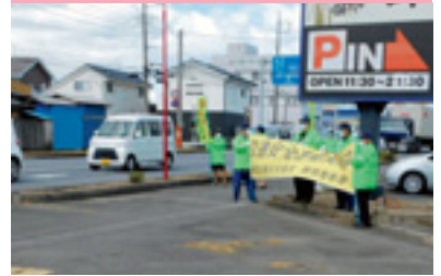
交通安全運動街頭指導