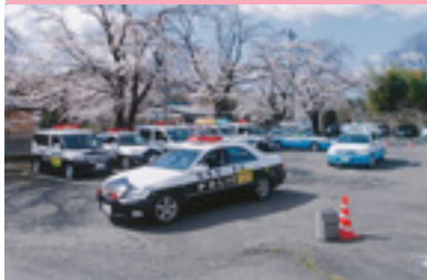
交通安全運動出動式