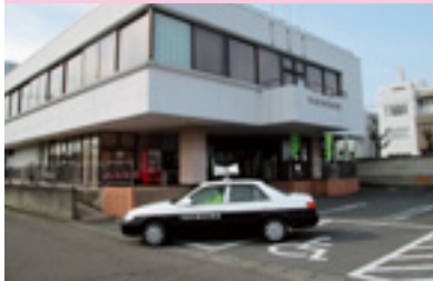
安全運動車両広報