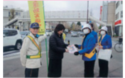
交通安全運動街頭指導