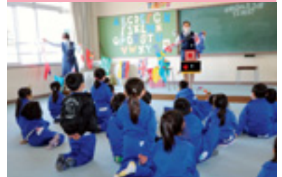
新入学児童交通安全教室