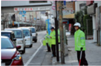
交通安全街頭指導