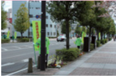
交通安全運動街頭指導