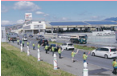
交通安全運動街頭指導