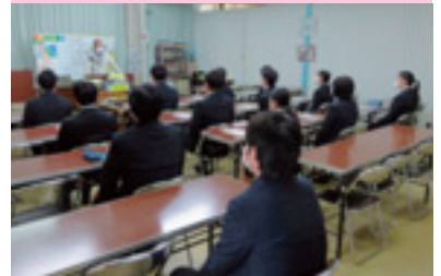
地元新採用職員交通事故防止研修

交通安全協会では、皆様の会費によって様々な交通安全活動を行っています。交通安全協会へのご入会をお願いいたします。