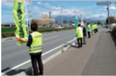
交通安全運動街頭指導