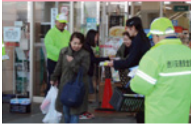
ショッピング作戦