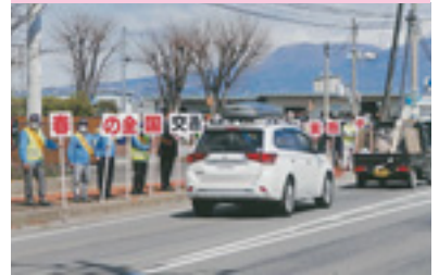
交通安全運動街頭指導