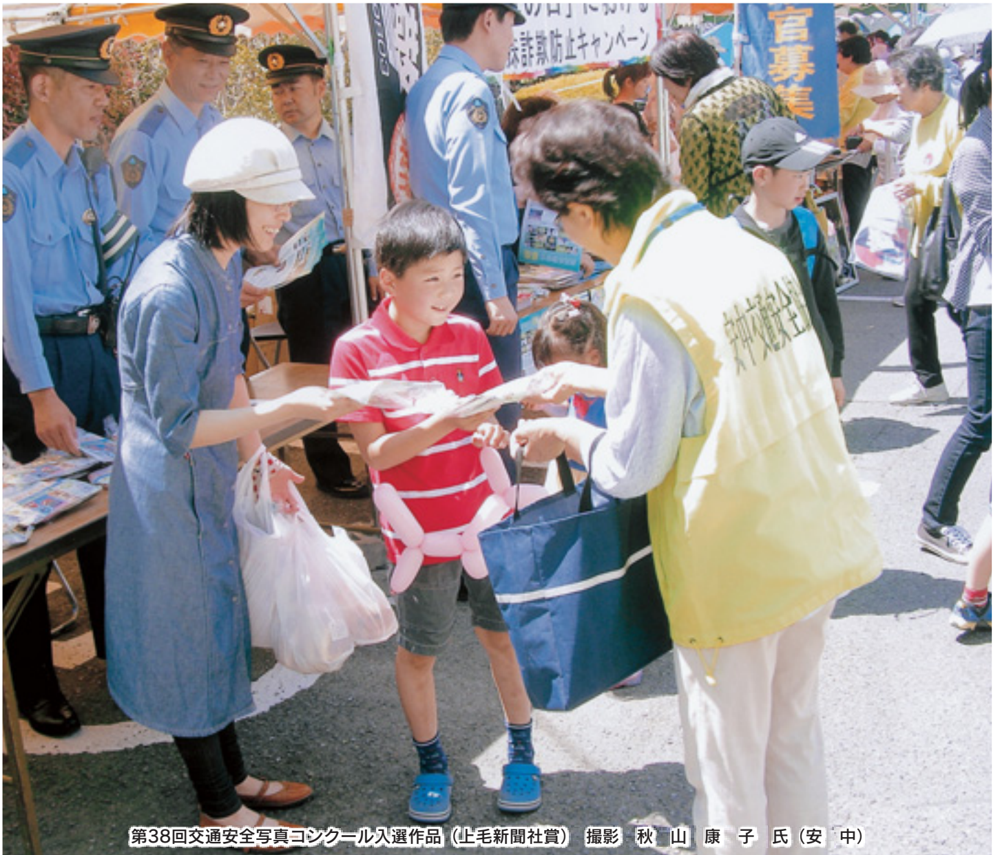
第38回交通安全写真コンクール入選作品 (上毛新聞社賞) 撮影 秋山 康子 氏 (安中)