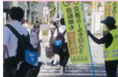
自転車マナーアップ運動