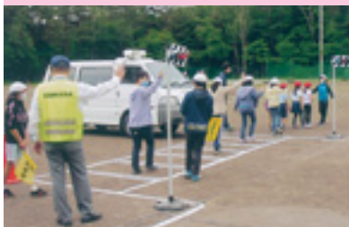
小学校交通安全教室