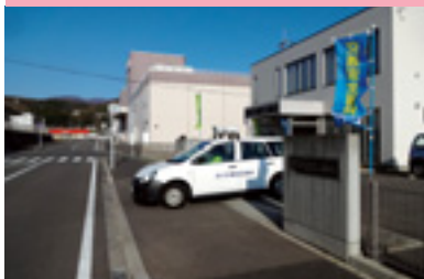
広報車交通安全活動