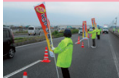
交通安全街頭指導