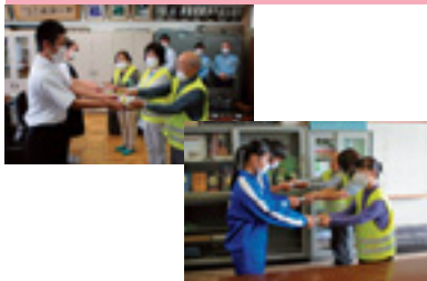
中学校自転車反射材贈呈