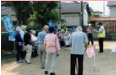
支部員高齢者交通安全教室