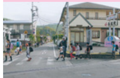
朝の交通安全指導