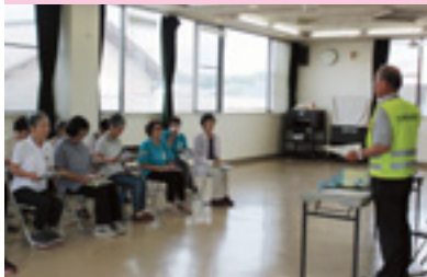
高齢者交通安全教室