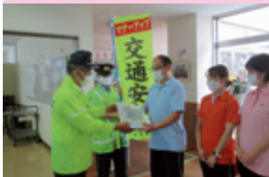
高齢者交通安全啓発