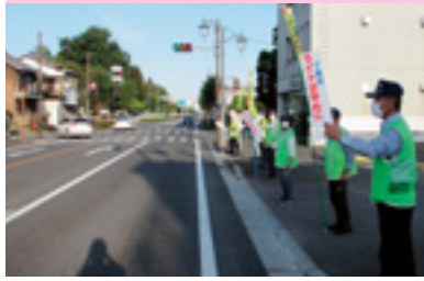
交通安全街頭指導