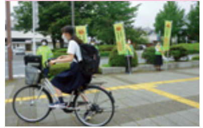
自転車マナーアップ運動