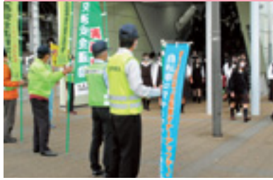
自転車マナーアップ運動