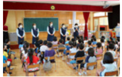
安協講師団交通安全教室