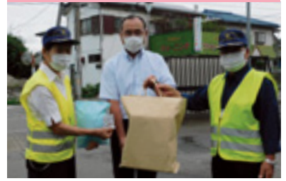
反射材サイクルキャップ贈呈