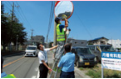
カーブミラー清掃活動