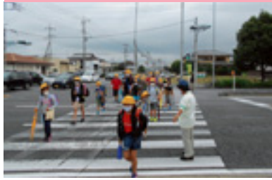
交通安全街頭指導