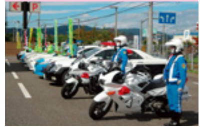
交通安全運動出動式

交通安全協会では、皆様の会費によって様々な交通安全活動を行っています。交通安全協会へのご入会をお願いいたします。