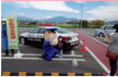
交通安全ショッピング作戦