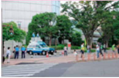
合同一斉街頭指導