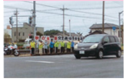
交通安全プラカード作戦