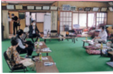
高齢者交通安全教室