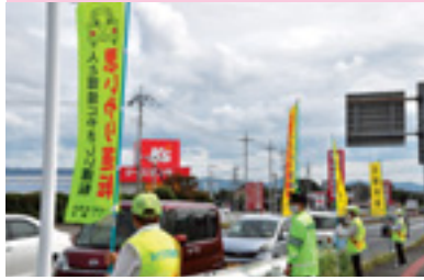
交通安全運動街頭指導