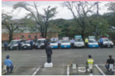
交通安全運動出発式