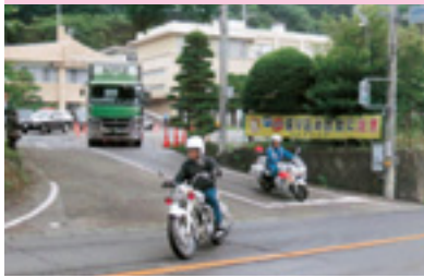
新旧白バイ等街頭パレード