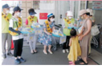
大型スーパー街頭指導