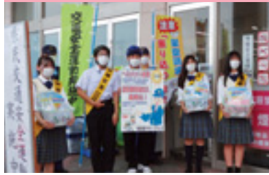
高校生交通安全街頭啓発