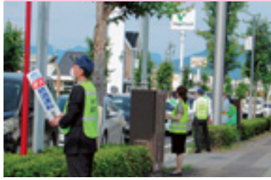
県民交通安全運動街頭指導