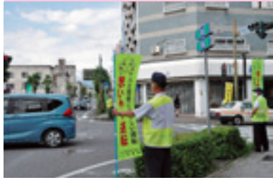
県民交通安全運動街頭指導