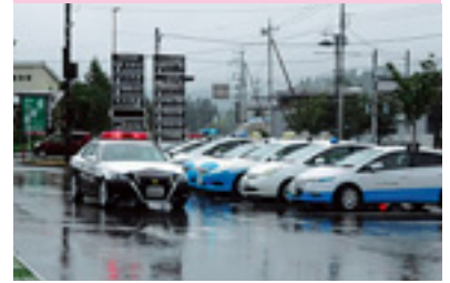
県民交通安全運動出動式

交通安全協会では、皆様の会費によって様々な交通安全活動を行っています。交通安全協会へのご入会をお願いいたします。