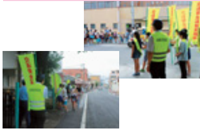
交通少年団街頭指導