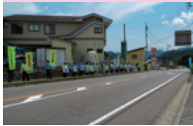
県民交通安全運動街頭指導