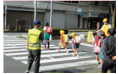
通学路保護誘導活動