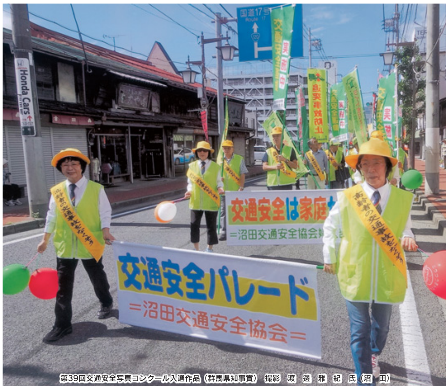
第39回交通安全写真コンクール入選作品 (群馬県知事賞)