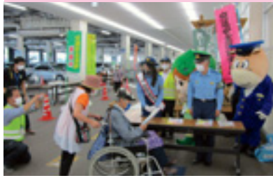
交通安全ショッピング作戦