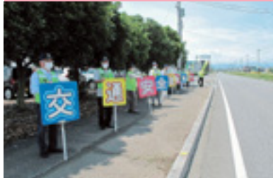
県民交通安全運動街頭指導