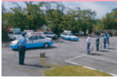
県民交通安全運動出動式