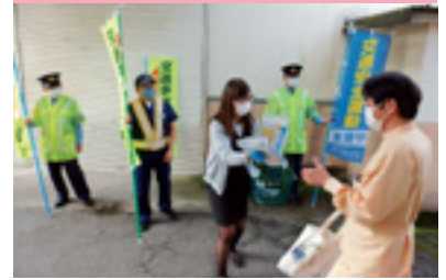
出勤時交通安全活動