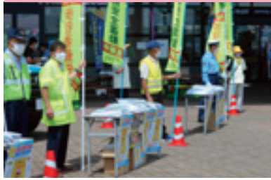
大型スーパー街頭指導