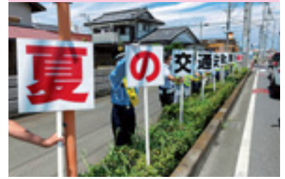
交通安全プラカード作戦