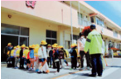
新入学児童交通安全教室