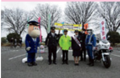
交通安全運動出動式