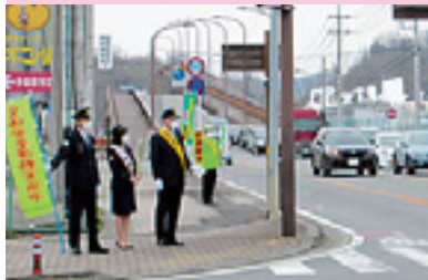
交通安全街頭一斉指導