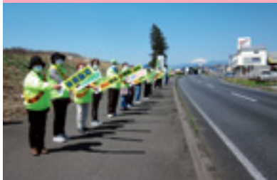
交通安全運動街頭指導