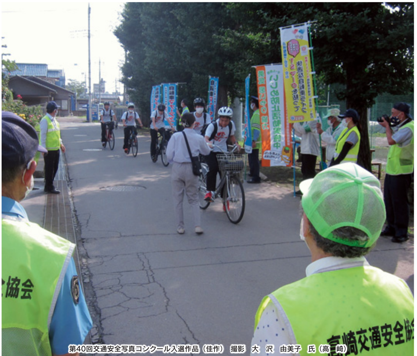
第40回交通安全写真コンクール入選作品(佳作) 撮影 大沢 由美子 氏(高崎)