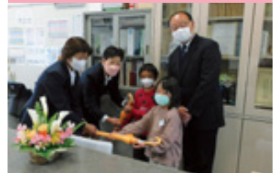
新入学児童交通安全傘贈呈