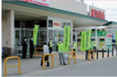
交通安全運動啓発活動