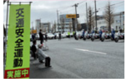
交通安全運動出動式