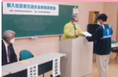
新入社員等交通安全体験研修会