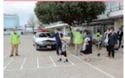
新入学児童交通安全指導