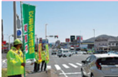
交通安全運動街頭指導