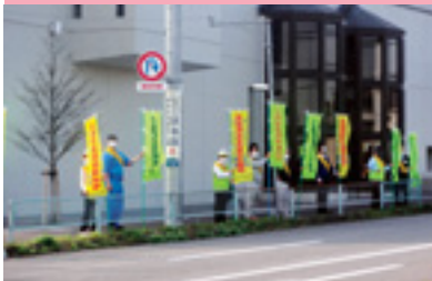
交通安全運動街頭指導