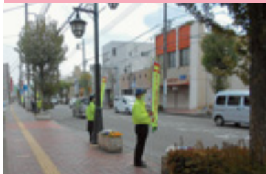
交通安全運動街頭指導