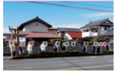
県民交通安全運動街頭指導