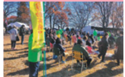
桜山まつり会場交通安全啓発