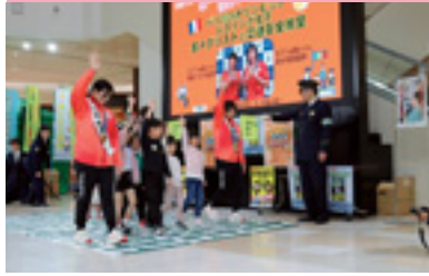
県民交通安全運動啓発イベント