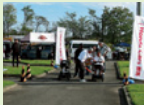
シニアカー体験講習

安全運転フェアでは、サポカー衝突被害軽減ブレーキ、電動シニアカーの安全運転講習と試乗、発炎筒の着火体験、運転適性検査などのほか、働く車の展示や白バイのデモ走行、バイクショップやキッチンカーの出店があり、多くの皆さんが来場しました。