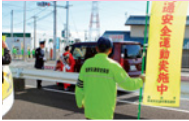
県民交通安全運動街頭指導