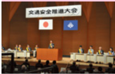
交通安全推進大会