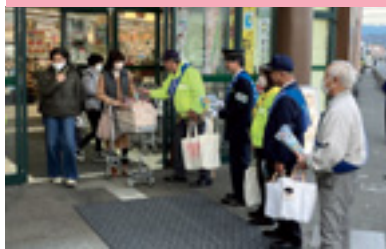
交通安全運動啓発キャンペーン