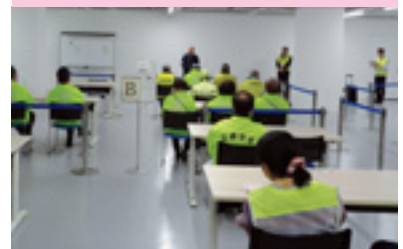
飲酒運転撲滅パトロール

交通安全協会では、皆様の会費によって様々な交通安全活動を行っています。交通安全協会へのご入会をお願いいたします。