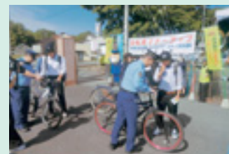
撮影者 後藤 志穂美 (渋川)