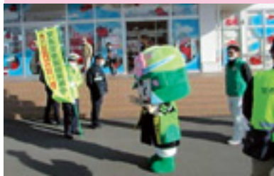
交通安全啓発活動