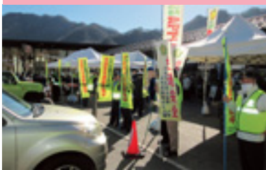
県民交通安全運動啓発活動