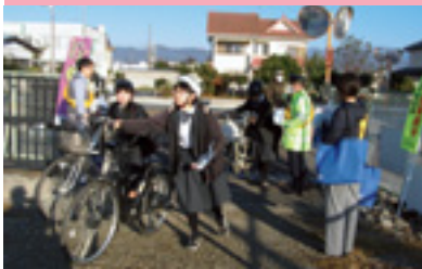
自転車交通事故防止啓発