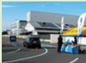
サポカー体験講習