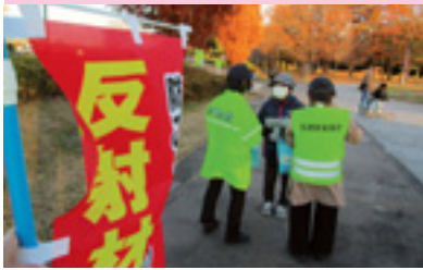
早めのライト点灯啓発