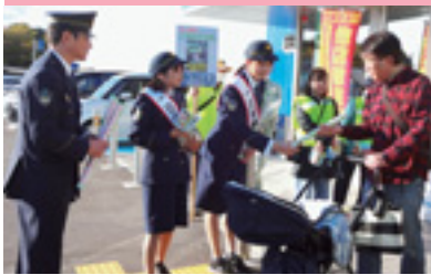
一日警察署長街頭指導