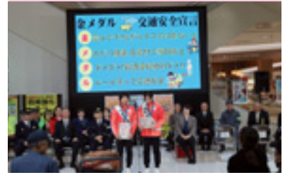
交通安全キャンペーン