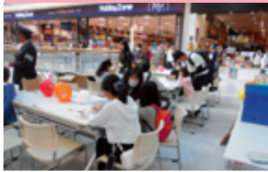
反射材作成ワークショップ活動